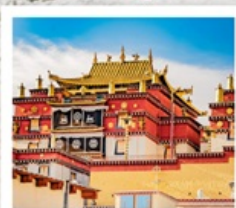
วัดชงจ้านหลิง

คุณหมิง • ยาดิง • เต๋อซิง • แชงกรีล่า 8 DAYS 7 NIGHTS