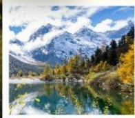
ปี้เผิงโกว