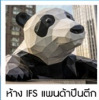
ห้าง IFS แพนด้าป็นตึก