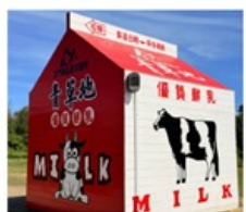
ฟาร์มโคนมจินเหมิน