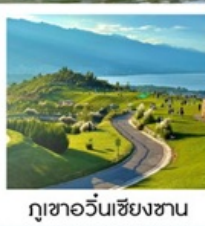
กุาขวั้นเซียงซาน