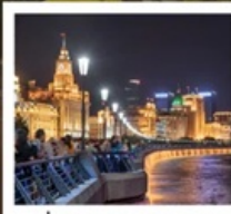
เซี่ยงไฮ้คลาสสิกไท่

เซี่ยงไฮ้ คลาสสิก ไท่ / 3 ตึกใหญ่แห่งเซี่ยงไฮ้ ล่องเรือหมู่บ้านโบราณจูเจียเจียว / EKA Tianwu / ถนนหอยโข่ง วัดหลงหัวแลนด์มาร์ก จางหยวน / ซินเทียนตี้ / ชมโชว์ ERA ที่โรงละครโด่งดังระดับโลก