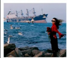
เรือควิวส

หอคอยกาลเวลา / รูปปั้นปลาวาฬ / ถนนโบราณเตาหยาง / ย่านสงโขว่ 1920 / เมืองเว่ยไห่ / ถนนฮั่วจวิปา / จตุรัสประตูแห่งความสุข ย่านอันลอฟาง / เรือควิวส / หาดซาจื่อฮั่ว / ถนนหลงเจียง / สะพานจันเจียว / หาดไซเบอร์ No. 3 ถนนจงซาน / โบสถ์ St.Emill / จตุรัส 54 / ศูนย์เรือใบโอลิมปิก / พิพิธภัณฑ์มิแยร์ชิงเต่า / ถนนโตตง / ท่าเรือประมงเหยียนโกะ