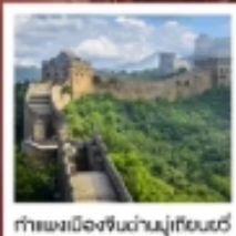
กำแพงเมืองจีนด้านมู่เทียนยวี่