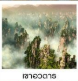
เซาอวตาร