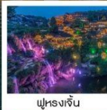
ฟูหรงเจิน