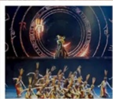
โชว์เว่ยชิว

เซี่ยงไฮ้ คลาสสิก ไนต์ (Shanghai Classic Night) หุบเขาเทวดาวังเซียนกู่ (ชมบรรยากาศกลางวันและกลางคืน) หมู่บ้านโบราณหวงหลิ่ง (รวมกระเช้าไปกลับ) สะพานกระจก ถนนโบราณกุนซี / โชว์การแสดงเว่ยชิว / หมู่บ้านโบราณเฉิงชาน ถนนหวยไห่ (ร้านกระเป๋าสองมอนต์) / เข็มเมนู 3 ดึกใหญ่แห่งเซี่ยงไฮ้ Tian An 1,000 Trees / North Bund Green Land / ถนนอู่กิง