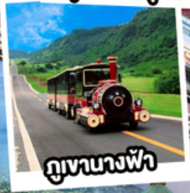
กุเจานางฟ้า