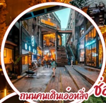
ถนนคนเดินเอ๋อหลิ่ง