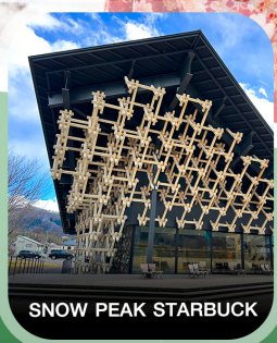
SNOW PEAK STARBUCK

คอนเฟิร์มออกเดินทาง ทุกพีเรียด 2 ท่านขึ้นไป