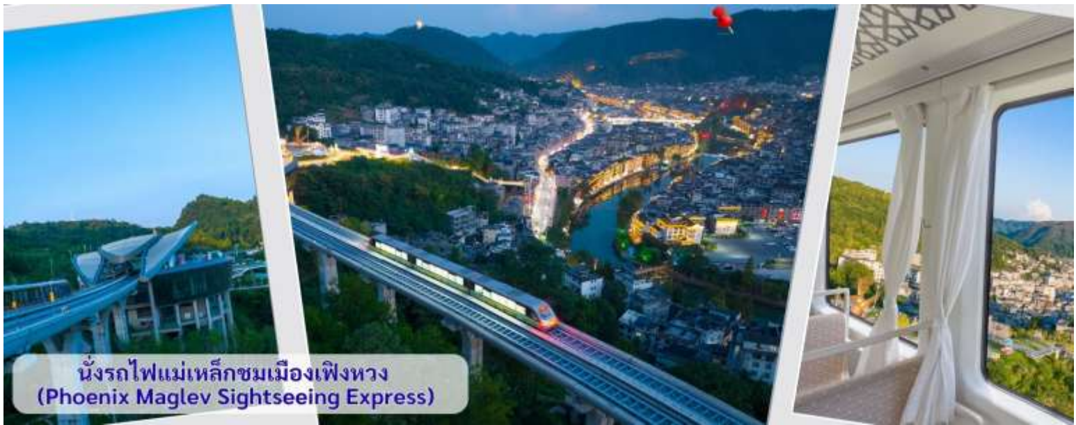
นั่งรถไฟแม่เหล็กชมเมืองเฟิงหวาง (Phoenix Maglev Sightseeing Express)

จากนั้นนำทุกท่าน เดินถนนโบราณ Feng Huang Ancient Town ที่ถนนช้อปปิ้ง Shibanshi Street เมืองที่ยังคงรักษาเอกลักษณ์ความเป็นพื้นเมืองผสมผสานกับยุคปัจจุบันเอาไว้ได้อย่างลงตัววิถีชีวิตของชาวบ้านที่อาศัยอยู่ที่นี่ บรรยากาศในเมืองเฟิงหวาง ถนนเก่าช้อปปิ้งเป็นถนนปูหินแคบๆ กว้างไม่ถึง 5 เมตร ทอดยาวจากทางเข้าวัดเต้าเหมินไปทางทิศตะวันตกผ่านถนนหลายสาย ได้แก่ ถนนครอส ถนนเจิ้งตวันออก ถนนเจิ้งตวันตง ศาลาฮุยหลง หียงเซียวชง เต้าซานลา ศาลาเจี้ยกัว และสุสานเซินฉงเหวิน สุดท้ายจะนำไปสู่ “น้ำพุแรกใต้ฟ้า” ถนนสายนี้มีความยาวกว่า 3,000 เมตร และเป็นย่านการค้าที่คึกคักที่สุดในเฟิงหวาง