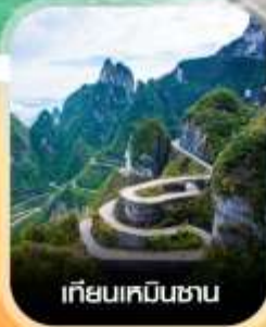
เกียมเหมินซาน