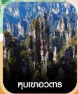
หุบเขาอวตาร

คอนเฟิร์มออกเดินทาง ทุกพีเรียด 2 ท่านขึ้นไป