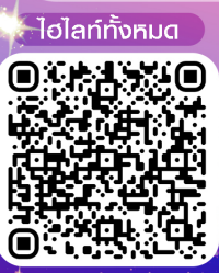
ไฮไลท์ทั้งหมด