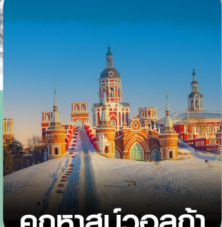
คฤหาสน์วอลก้า