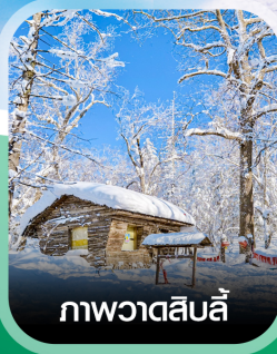
ภาพวาดสีบลี