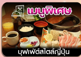
เมนูพิเศษ บุฟเฟ่ต์สไตล์ญี่ปุ่น

ซัปโปโร-ชมทุ่งดอกลาเวนเดอร์-โทมิตะฟาร์ม-ชิชิไซโนะโอกะ-น้ำตกชิราอิเกะ-บ่อน้ำสีฟ้า-อีสระะซ็อบบั้งเต็มวัน-ฟักออนเซน