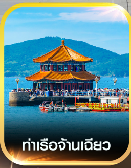
ท่าเรือจันทิว

✈️ คอนเฟิร์มออกเดินทาง ✈️ ทุกพีเรียด 2 ท่านขึ้นไป