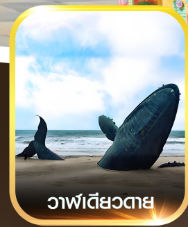
วาฬเดี่ยวตาย