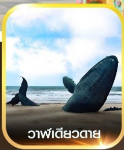
วาฬเดี่ยวตาย

คอนเฟิร์มออกเดินทาง ทุกพีเรียด 2 ท่านขึ้นไป