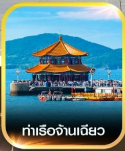
ท่าเรือฉางเฉียว