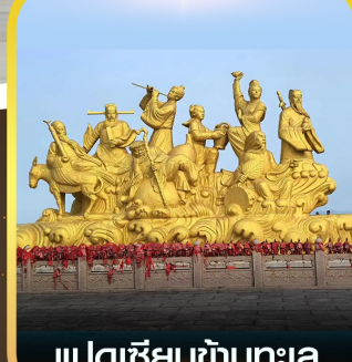
แปดเซียนข้ามทะเล