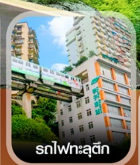
รถไฟฟ้าสุติก

✈️ คอนเฟิร์มออกเดินทาง ทุกพีเรียด 2 ท่านขึ้นไป