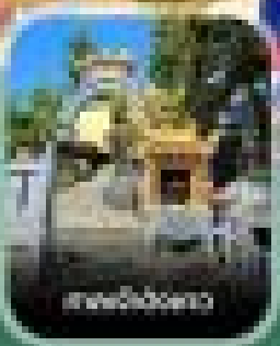
พระเข่ามิ่งอัน

เขตกินสวนสนุก VinWonders ใหญ่ที่สุดของเวียดนาม มีพระเข่ามิ่งอันทะเล สวนสนุกอันเป็น ต้นสาวกวางเจมรูปเล่า อาม่าจักรสีตัวน้ำ