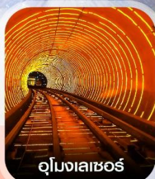
อุโมงเลเซอร์

✈️ คอนเฟิร์มออกเดินทาง ทุกพีเรียด 2 ท่านขึ้นไป