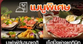
เมนูพิเศษ นูฟฟัดนาชาติ เซ็ตบั้งย่างยากินุ

พุทโศกะ-วัดนินโซอิน-หมู่บ้านยูฟูอิน-แบบบุ-บ่อนรกจิกุ-แซ่ออนเซ็น-ช้อปิ้งเทนจิน-พักใกล้แหล่งช้อปิ้ง2คืน