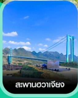
สะพานฮวาเจียง

เช็กอินก่อนใคร สะพานที่สูงที่สุดในโลก สะพานฮวาเจียง น้ำตกหวงกั๋วชู่ หมู่บ้านวู่เจียงจ้าย