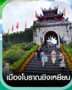
เมืองโบราณซิงเหียน

✈️ คอนเฟิร์มออกเดินทาง ✈️ ทุกพีเรียด 2 ท่านขึ้นไป