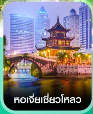
หอเจียเซียวไหล