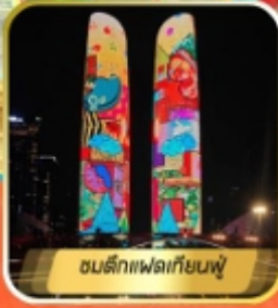
ตึกแฟล็กเทียนฟู