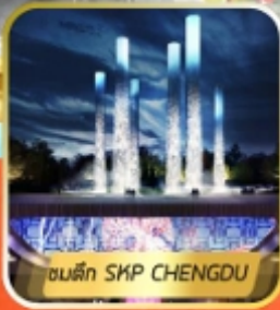
ตึก SKP CHENGDU