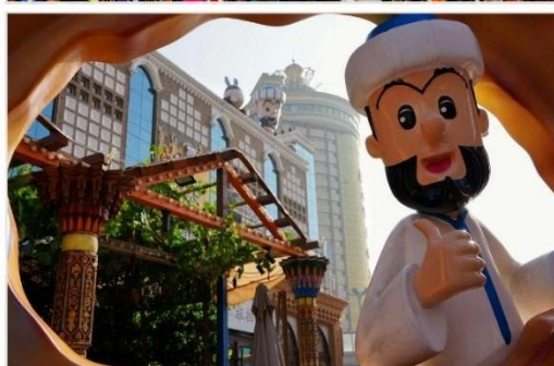
ตลาดนานาชาติซินเจียงแกรนด์บาร์ซาร์