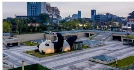
รูปปั้นแพนด้าเซลฟ์