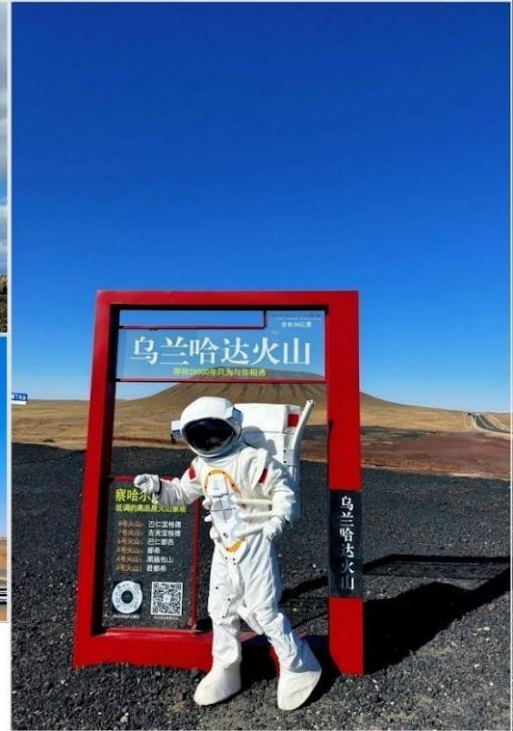
อุทยานภูเขาไฟอูลันฮาตา (Wulanhada Volcano Geopark)

คำ บริการอาหารค่ำ ณ ภัตตาคาร ที่พัก Shang Jing Hotel ระดับ 4* หรือเทียบเท่า