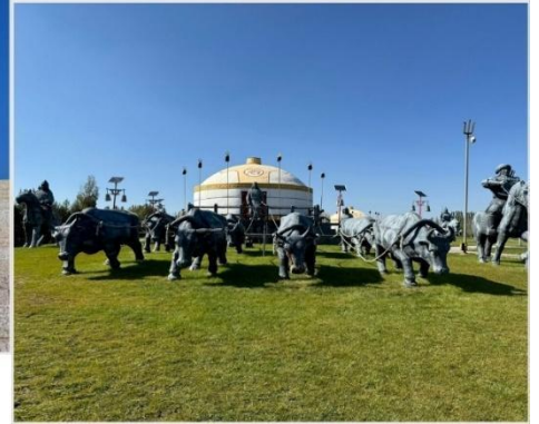
เขตท่องเที่ยวเจงกิสข่าน • กลุ่มประติมากรรม กองทัพเหล็กและกระโจมทอง

บ้าย จากนั้นนำท่านตามรอยเท้าของมหาบุรุษผู้ยิ่งใหญ่ "เจงกิสข่าน" (Genghis Khan) นำท่านชม เขตท่องเที่ยวเจงกิสข่าน (Genghis Khan Tourist Area, 成吉思汗旅游区) ซึ่งเป็นสถานที่สำคัญทาง ประวัติศาสตร์ และวัฒนธรรมที่ตั้งอยู่ในเมืองเอ้อเอ๋อร์ตัวซือ (Ordos) เขตปกครองตนเองมองโกเลียในประเทศจีน ที่นี่ไม่เพียง เป็นสถานที่รำลึกถึงเจงกิสข่าน แต่ยังเป็นศูนย์รวมประสพการณ์ที่จะพาคณย้อนเวลากลับไปสู่ยุครุ่งเรือง ของชนเผ่า มองโกล ชมหนึ่งในไฮไลต์ กลุ่มประติมากรรม กองทัพเหล็กและกระโจมทอง (铁马金帐群雕) จำลองภาพ กองทัพ ของเจงกิสข่านและขบวนทัพออกศึกได้อย่างสมจริง แสดงถึงความแข็งแกร่ง แสนยานุภาพและวินัยของ กองทัพ มองโกลผู้พิชิตโลก คุณจะรู้สึกราวกับได้ยืนอยู่ท่ามกลางประวัติศาสตร์อันยิ่งใหญ่