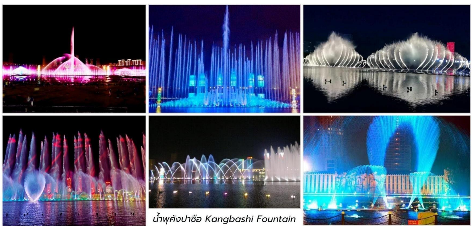
น้ำพุคังปาซือ Kangbashi Fountain

*หมายเหตุ : น้ำพุคังปาซือ เริ่มเปิดการแสดงตั้งแต่ เดือน พ.ค.69 เป็นต้นไป อาจจะมียกเลิกในบางวัน ทั้งนี้ขึ้นอยู่กับ การประกาศเปิด-ปิด จากทางราชการเท่านั้น