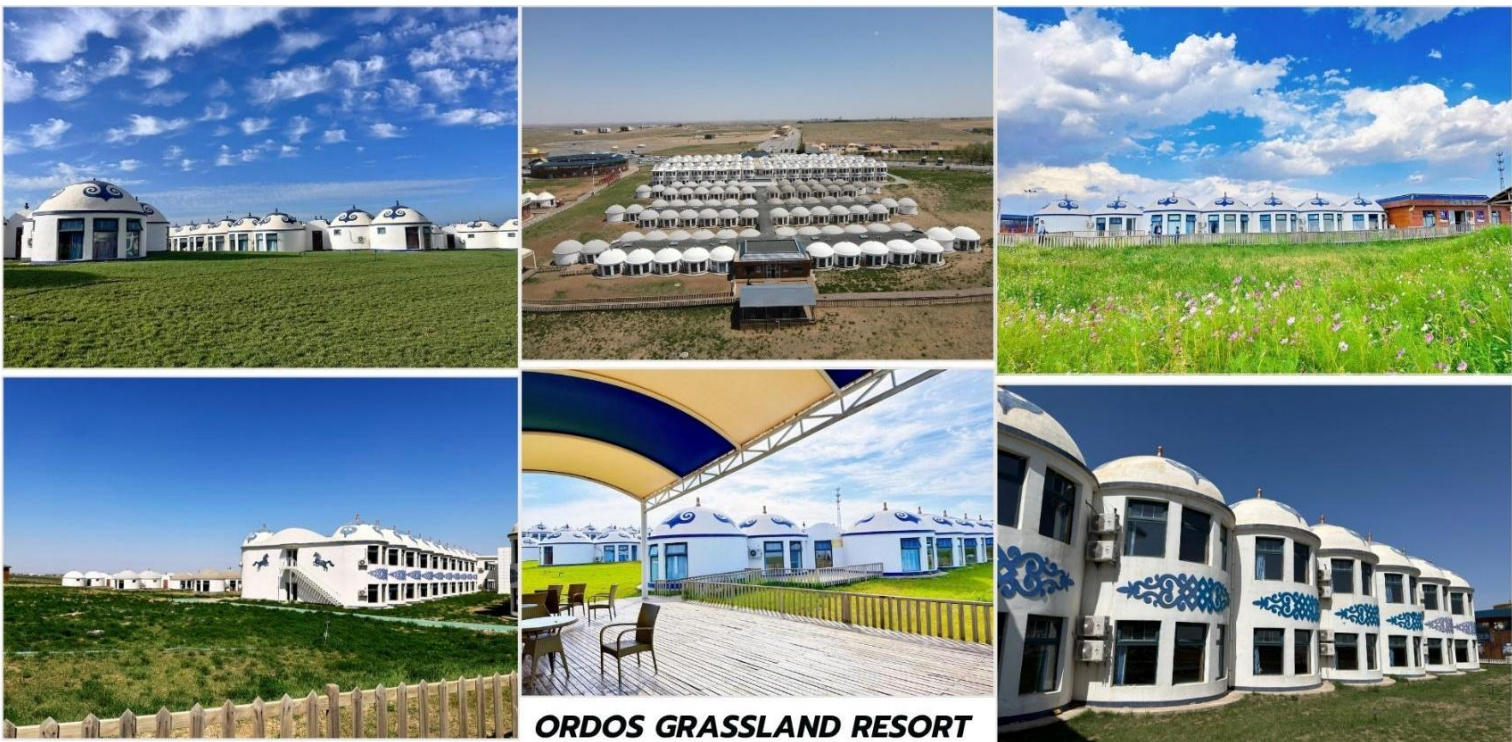
ORDOS GRASSLAND RESORT

***หมายเหตุ : สำหรับกรุ๊ปที่เดินทางช่วงเดือน เมษายน-พฤษภาคม ที่พักรีสอร์ทมองโกลยังไม่เปิดให้บริการ จะเปลี่ยนเป็นพักโรงแรม ระดับ 4* แทน ในช่วงเวลาดังกล่าว