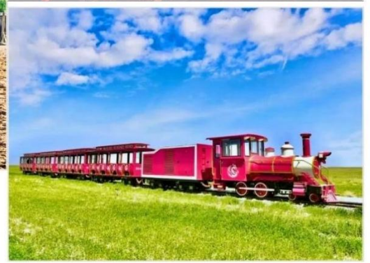
OPTION TOUR.. กิจกรรมทุ่งหญ้าออร์ดอส (Ordos Prairie)