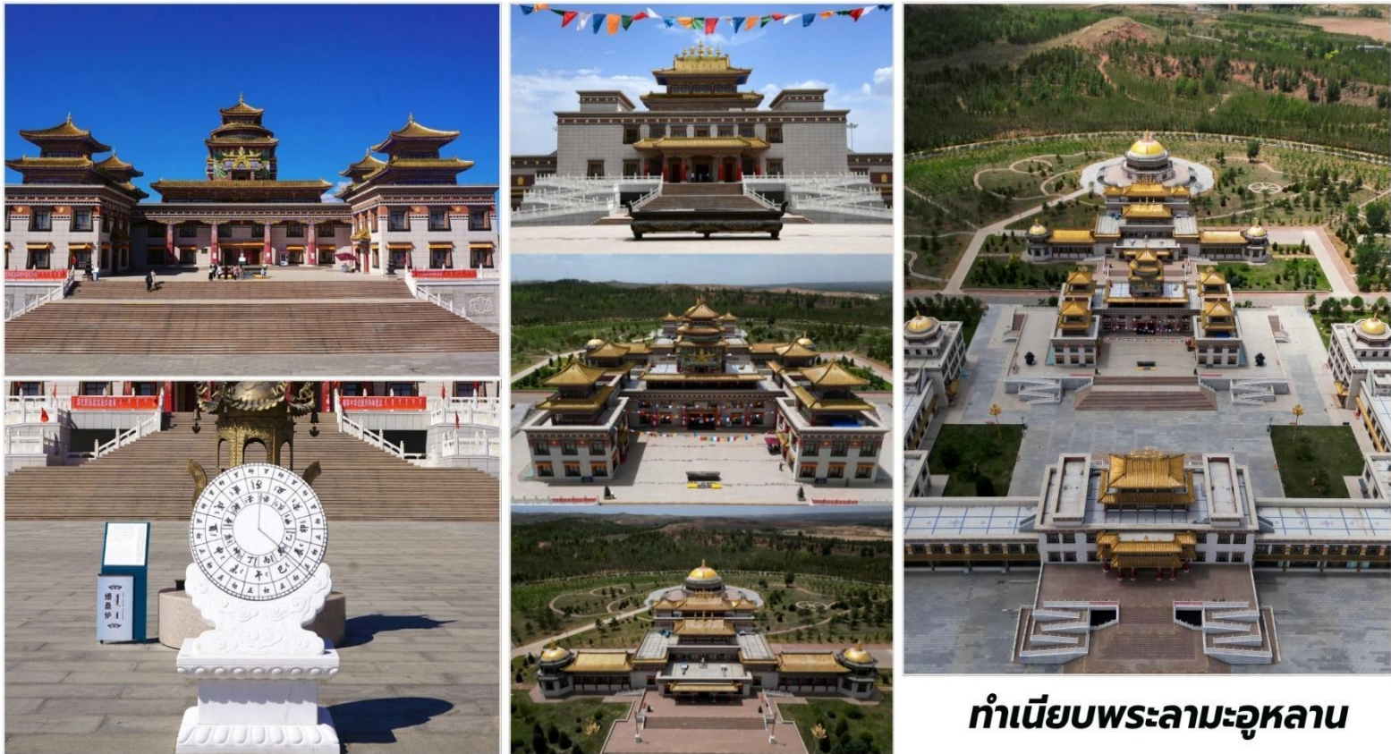
ทำเนียบพระลามะอุหลาน

นำท่านชม ทำเนียบพระลามะอุหลาน (Ulan Living Buddha Mansion) เป็น ศาสนสถานอันศักดิ์สิทธิ์ แต่ยังเป็นเสมือนพิพิธภัณฑ์มีชีวิตที่บอกเล่าเรื่องราวของพระพุทธรูปศาสนามานิกายทิเบต ที่หยั่งรากลึกในวัฒนธรรมมองโกล ทำเนียบพระลามะอุหลาน สร้างขึ้นเพื่อเป็นที่ประทับและศูนย์กลางการเผยแพร่ธรรมของพระลามะอุหลานซึ่งเป็นพระลามะที่มีความสำคัญยิ่งต่อศรัทธาและความเชื่อของชาวมองโกลในภูมิภาคนี้ การมาเยือนที่นี่จึงไม่ใช่แค่การท่องเที่ยวชมอาคารแต่เป็นการเดินทางสู่โลกแห่งความสงบศรัทธาและประวัติศาสตร์ที่ตื่นตาตื่นใจกับ สถาปัตยกรรมที่วิจิตรตระการตา ซึ่งเป็นการผสมผสานอย่างลงตัวระหว่างศิลปะแบบมองโกล ฮั่นและทิเบต อาคารสูงตระหง่าน หลังคาสีสนิมสดใส รายละเอียดการแกะสลักและการตกแต่งที่ประณีต ล้วนสะท้อนถึงความรุ่งรวย ทางศิลปะและวัฒนธรรมอันเป็นเอกลักษณ์