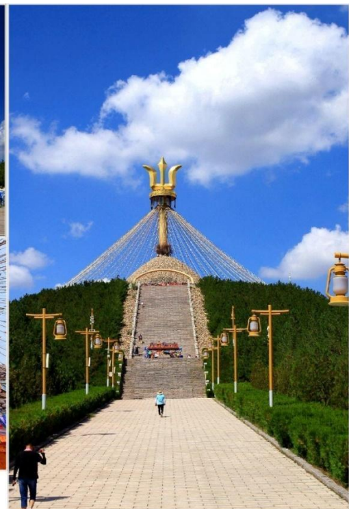
อี้เค่อโอบโ (Great Obla, 伊克敖包)