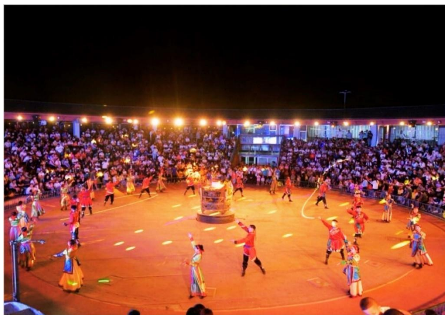
งานราตรีรอบกองไฟมองโกเลีย

นำท่านเดินทางสู่ทุ่งหญ้าออร์ดอส ใช้เวลาเดินทางประมาณ 2 ชั่วโมง ค่า บริการอาหารค่ำ ณ ภัตตาคาร