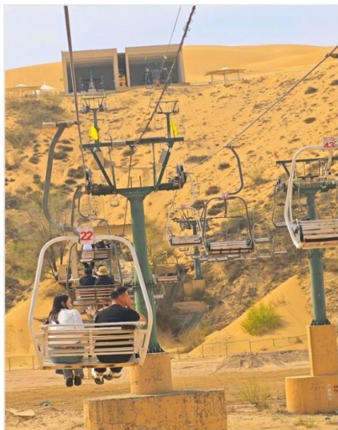
พิเศษ...ขึ้นกระเช้าชมวิว (รวมค่าขึ้นกระเช้า) เขตทะเลทรายเสียงซาวาน