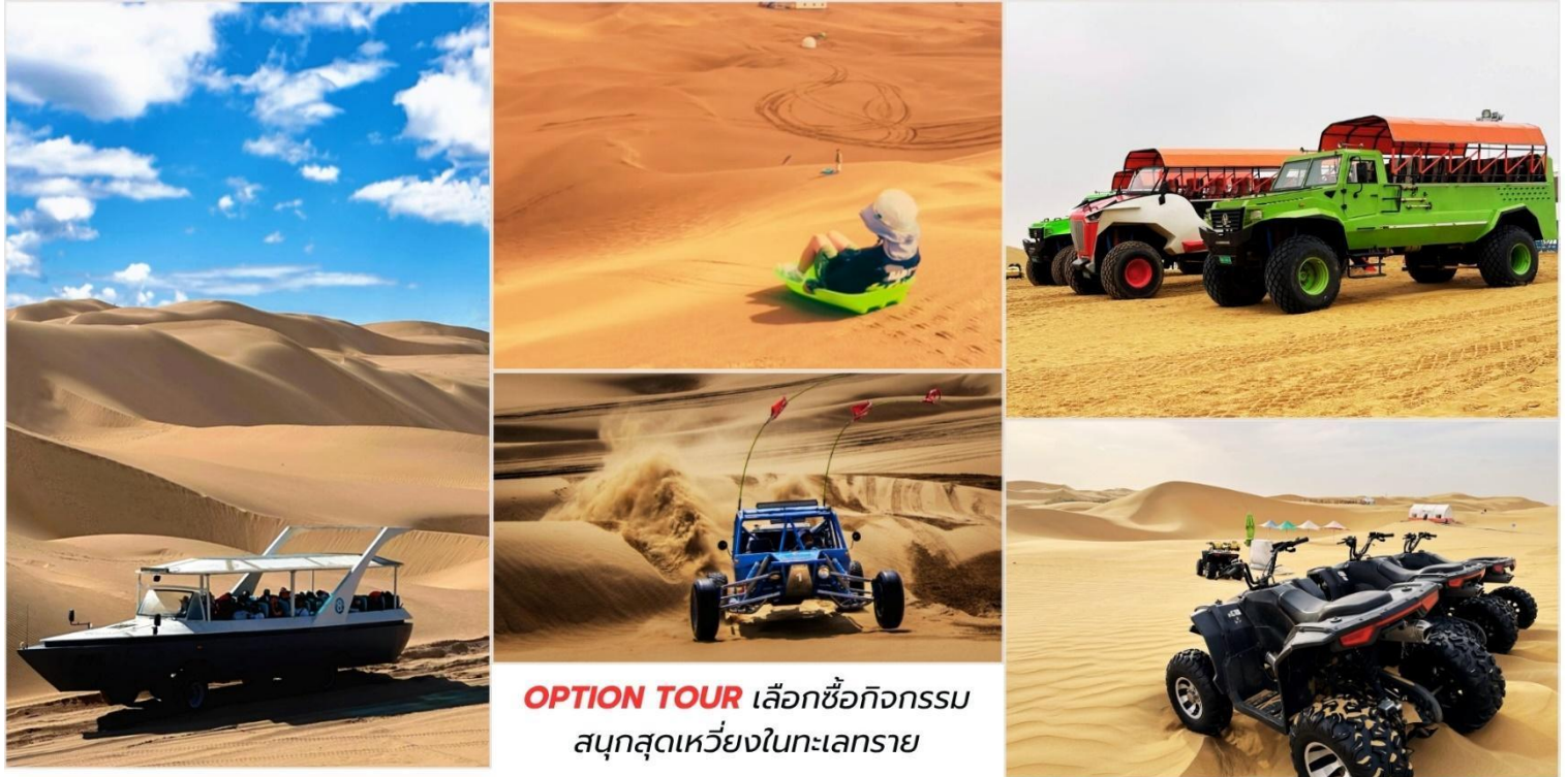
OPTION TOUR เลือกซื้อกิจกรรม สนุกสุดเหวี่ยงในทะเลทราย

*หมายเหตุ อัตราค่าบริการอาจมีการเปลี่ยนแปลง โปรดตรวจสอบ ณ จุดจำหน่ายบัตรอีกครั้ง