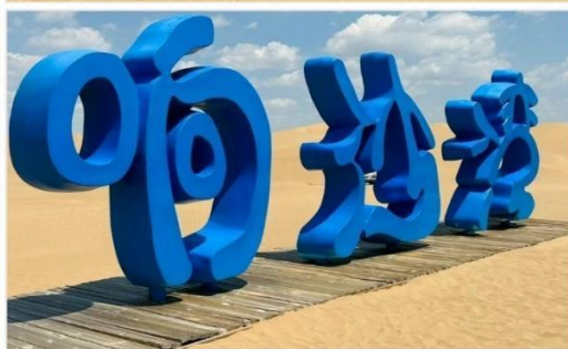
ทะเลทรายเสียงซาวาน