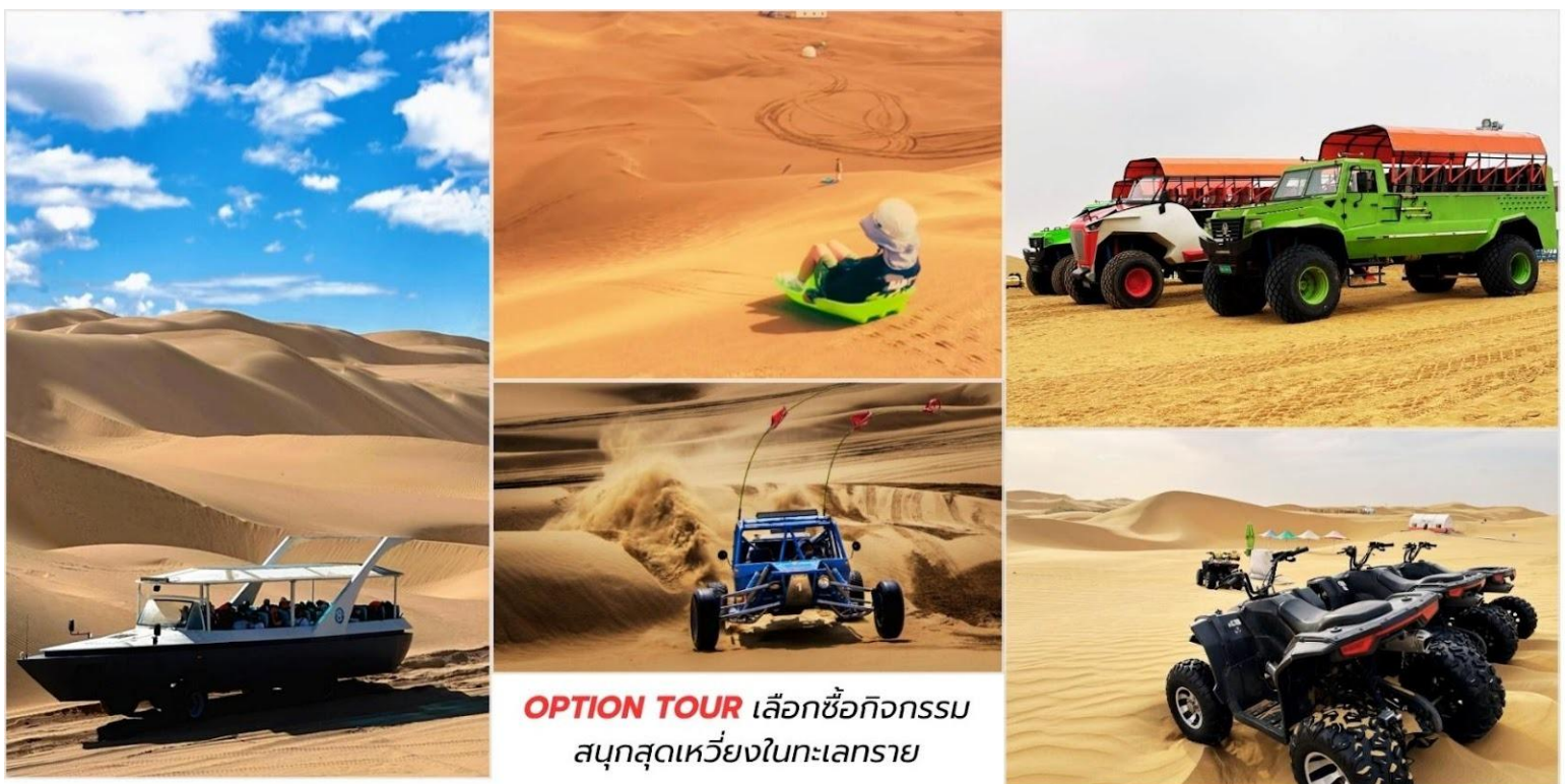
OPTION TOUR เลือกซื้อกิจกรรม สนุกสุดเหวี่ยงในทะเลทราย

*หมายเหตุ อัตราค่าบริการอาจมีการเปลี่ยนแปลง โปรดตรวจสอบ ณ จุดจำหน่ายบัตรอีกครั้ง