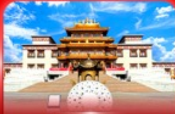
วัดพระโพธิสัตว์จุลาน