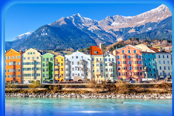
อาคารสีลูกกวาด อินส์บรุค