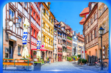
ย่านเมืองเก่า บูเรมเบิร์ก