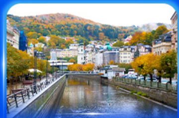
เมืองแห่งสา คาร์โลลิวารี