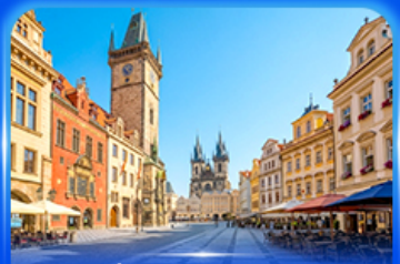
ย่านจัตุรัสปราก