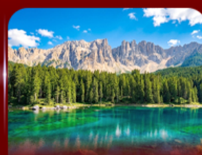
ชมวิวโดโลไมท์ ทะเลสาบคาเรซา