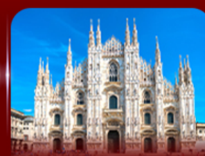
เข็ควินมหาวิหารดูโอโม มิลาน