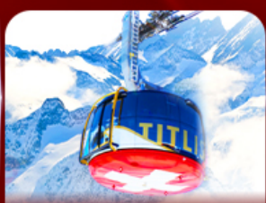
*Optional* นั่งกระเช้าชมวิวทิวทัศน์