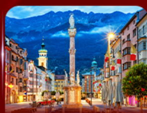
เที่ยวย่านเมืองเก่า อินส์บรุค