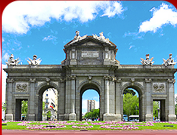
เช็ควินประตูอัลกาลา มาดริด