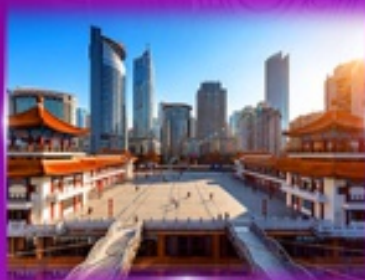
เข็ควิน ตึกโค่วซิงโหล