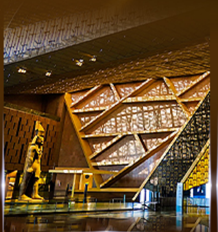
พิพิธภัณฑ์แกรนด์อียิปต์ (GEM)