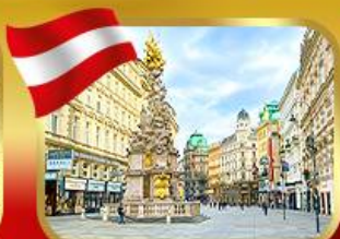
ช้อปปิ้งย่านคาร์ทเนอร์สตรีก