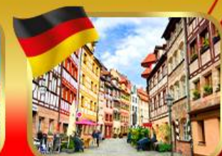
เที่ยวย่านเมืองเก่ามูเรมเบิร์ก