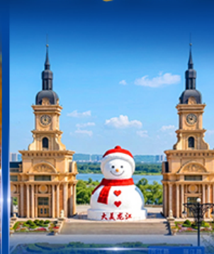
ตึกตาสหะฮักฮิ ฮาร์ฮิน