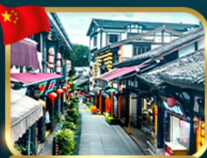
หมู่บ้านโบราณฉือซื่อ

เที่ยวอุทยานหลุมพี้สะพานสวรรค์ + เขานางฟ้า