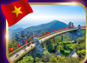
สะพานมือสีทอง บานาฮิลล์