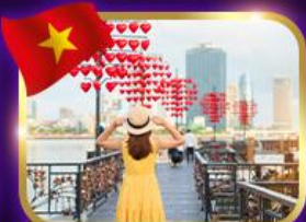
เช็คอินสะพานแห่งความรัก