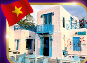
คาเฟ่สุดชิค ซานทรา มารีน่า