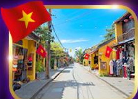
เมืองเก่ามรดกโลก ฮอยอัน