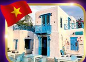
คาเฟ่สุดชิค ซานทรา มาริน่า