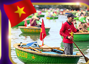
เรือกระด้ง หมู่บ้านกัมทาน