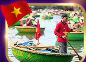
เรือกระด้ง หมู่บ้านกิมทาน