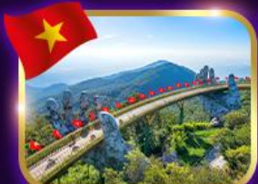
สะพานมือสีทอง บานาฮิลล์