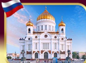
มหาวิหารเซนต์ซาเวียร์