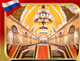
สถานีรถไฟใต้ดินกรุงมอสโก