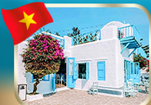
คาเฟ่สไตล์ชาบโตรีนี่ ซันทรา เทริน่า