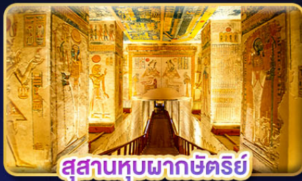
สุสานหุบผากษัตริย์