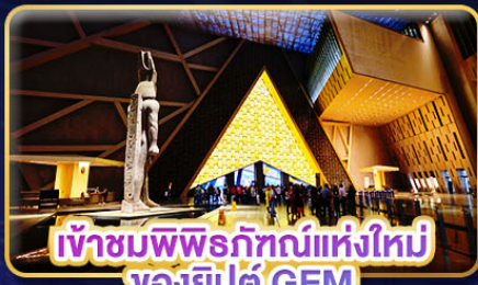
เข้าชมพิพิธภัณฑ์แห่งใหม่ ของอียิปต์ GEM