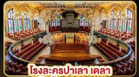
โรงละครปาเลา เคลา มูสิกก้า คาทาลานา