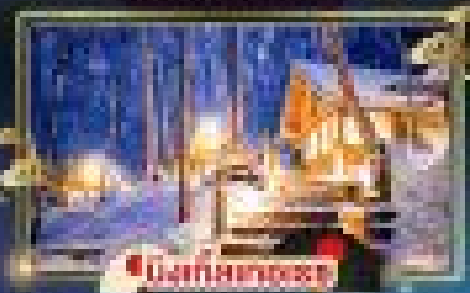
เมืองโทมามู