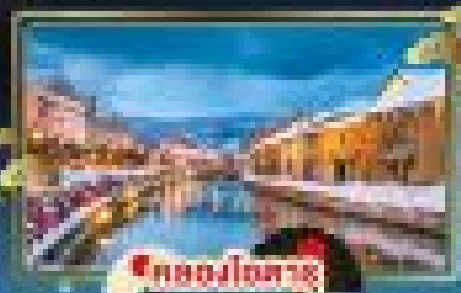
เมืองโอตารุ