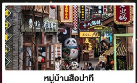
หมู่บ้านสีปาทิ