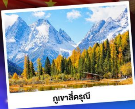
กู๋เขาสีครุณี

ชมบรรยากาศใบไม้เปลี่ยนสี "สถานที่ท่องเที่ยว 5A อุทยานจิวจ้ายโกว"