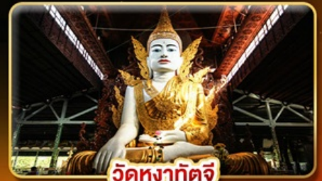
วัดหงส์ทิศจี