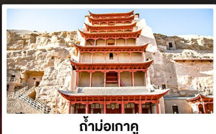
ถ้ำม่อเกาตุ