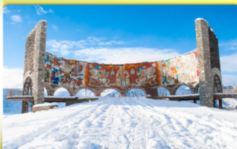
อนุสรณ์สถานรัสเซีย