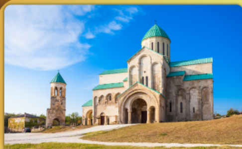
มหาวิหารบากราติ