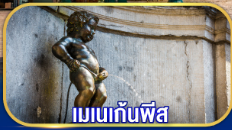
เมเนกั้นพีส