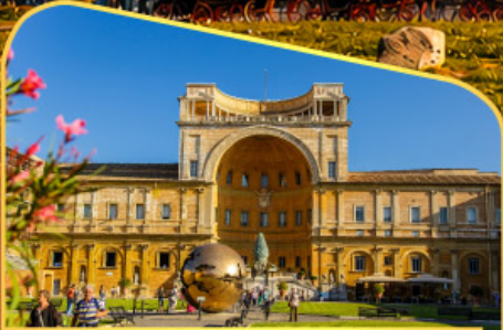
เข้าชมพิพิธภัณฑท์วาติกัน